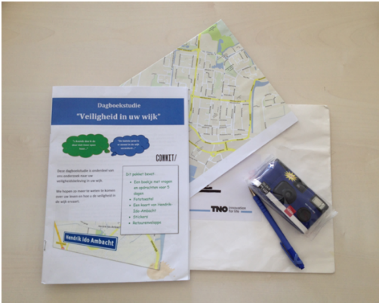
Afbeelding 2. Cultural probe gebruikt in Hendrik-Ido-Ambacht: instructies, dagboekje, plattegrond van Hendrik-Ido-Ambacht en een wegwerpcamera.

tot ontwerpinspiratie. In dit geval was het doel meer inzicht verkrijgen in de situatie van de ouderen en hun gevoel van veiligheid in de wijk. Het cultural probe-pakket bestond uit een dagboekje, instructies, een plattegrond van Hendrik-Ido-Ambacht en een wegwerpcameraatje (afbeelding 2). De deelnemers werd gevraagd gedurende vijf dagen elke dag een kleine opdracht uit te voeren en aan het eind van de week alles in te leveren. Het doel van de tweede workshop was hun persoonlijke ervaringen met elkaar te delen. Tijdens de workshop zijn eerst de resultaten van de cultural probe gepresenteerd, besproken met de deelnemers en aangevuld met persoonlijke ervaringen en meningen. Daarnaast is een verkenning gedaan naar hun huidige technologiegebruik, zowel apparatuur als diensten. De deelnemers kregen stickers met hierop verschillende apparatuur en diensten, die ze, indien ze deze gebruikten, moesten plakken in een matrix met op de ene as 'fijn in gebruik' en 'niet fijn in gebruik' en de andere as 'vaak gebruik' en 'minder vaak gebruik' (afbeelding 3). De kwalitatieve resultaten worden hierna gepresenteerd volgens de categorieën van sociale veiligheid. In het algemeen vond men Hendrik-Ido-Ambacht rustig en sociaal