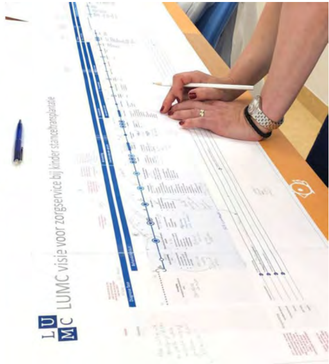
Afbeelding 2. Co-creatie van gedeelde besluitvorming met zorgprofessionals met behulp van de Metro Map.

Metro Mapping in andere zorgpaden onderzocht worden. In Nederland is de methode reeds toegepast voor het zorgpad bij COVID-19. Op internationaal niveau zal de implementatie van Metro Mapping ook onderzocht worden, onder andere in het '4D PICTURE'-project, gefinancierd door Horizon Europe. In dit project, waarbij verschillende Europese partners betrokken zijn, zal Metro Mapping uitgangspunt zijn voor de ontwikkeling en implementatie van datagedreven beslissingsondersteuning in de oncologie en daarmee ook zelf als service design-methode verder ontwikkeld worden.